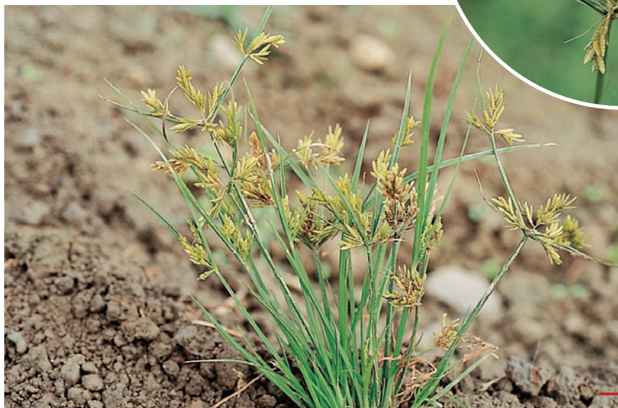
圖十四：碎米莎草成株及花。 （袁秋英、蔣慕琰）