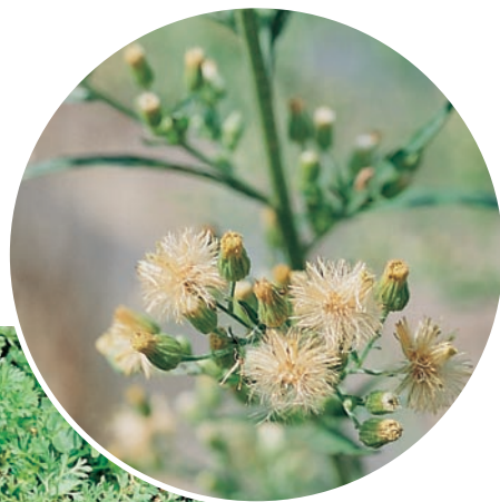
圖十一：野苘蒿成株及花。（袁秋英、蔣慕琰）