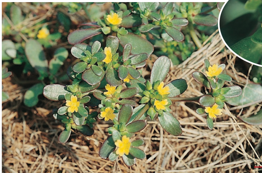
圖二十二：馬齒莧成株及花。 （袁秋英、 蔣慕琰）

特性：屬暖季草，喜溫暖潮濕，葉片肉質，耐旱性強，株型低矮，但常無法以除草劑完全防除。