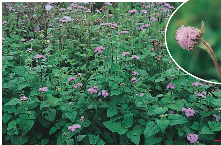
圖九：紫花藿香薷成株及花。 （袁秋英、蔣慕琰）

特性：全年可萌芽生長，株形高大，常形成優勢群落，易與果樹競爭養水分及干擾園區之管理，危害潛力高。