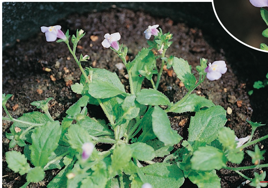
圖二十三：通泉草成株及花。(袁秋英、蔣慕琰)