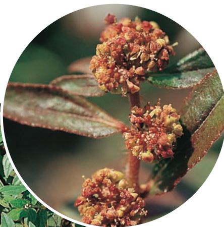
圖十六：飛揚草成株及花。 (袁秋英、蔣慕琰)