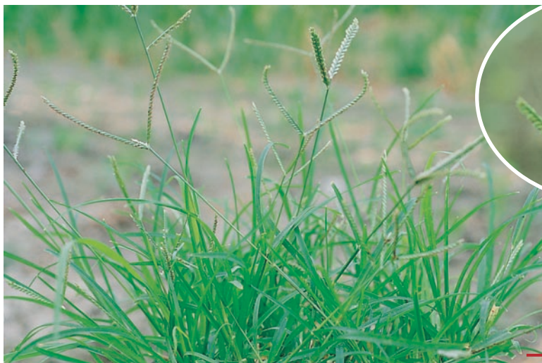
圖十九：牛筋草成株及花。 （袁秋英、蔣慕琰）

特性：耐踐踏，群落漸增加，植株葉表不易吸附藥劑，常無法以除草劑完全防除之，臺灣中南部部分園區之牛筋草，對嘉磷塞及禾草防治藥劑已產生抗性，危害潛力高。