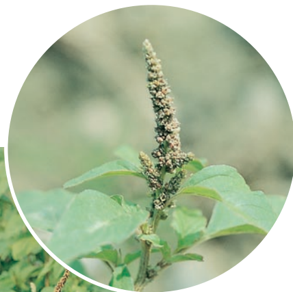
圖六：野苋成株及花。（袁秋英、蔣慕琰）