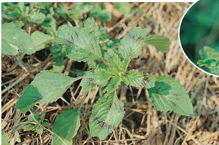
圖五：凹葉野萵菜成株及花。 （袁秋英、蔣慕琰）

習性：生活史：一年生草本 萌芽期：全年（以春至秋季為主） 花期：3～11月 繁殖方法：種子 種子量：數百粒至數千粒/株 特性：喜溫暖，易形成群落，常為園區內外主要植物，危害潛力中等。