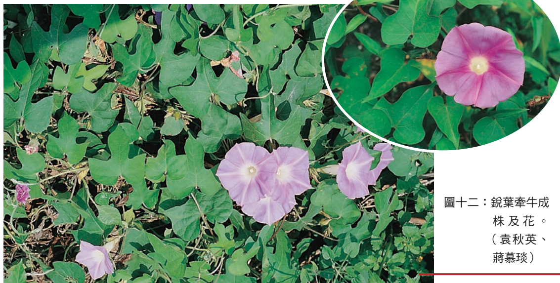
圖十二：銳葉牽牛成株及花。 (袁秋英、蔣慕琰)