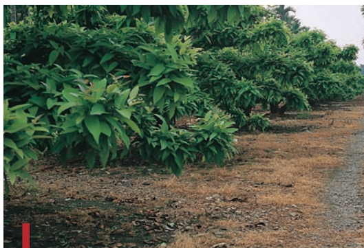
圖二十七：噴施除草劑之蓮霧園。