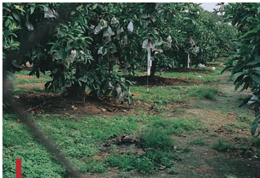
圖三：屏東地區之蓮霧園。（袁秋英、蔣慕琰）

雜草依萌芽及生長適溫，可分為暖季草、冷季草和全年生長者三大類別，一般一年生禾本科和莎草科植物皆屬暖季草，於春季氣溫回升，即大量萌芽，如牛筋草、馬唐、碎米莎草等，此外凹葉野苧菜、紫背草、華九頭獅子草亦屬暖季草。冷季草為秋末冬初氣溫降低，才開始萌芽生長者，如焊菜、荷蓮豆草、節花路蓼、葉下珠及黃鸛菜等。可適應臺灣四季氣候變化而全年生長者，包括龍葵、紫花藿香薊、大花咸豐草、野苧等。由於蓮霧園區內雜草大多為複合植