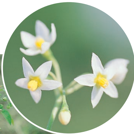
圖二十四：龍葵成株及花。（袁秋英、蔣慕琰）