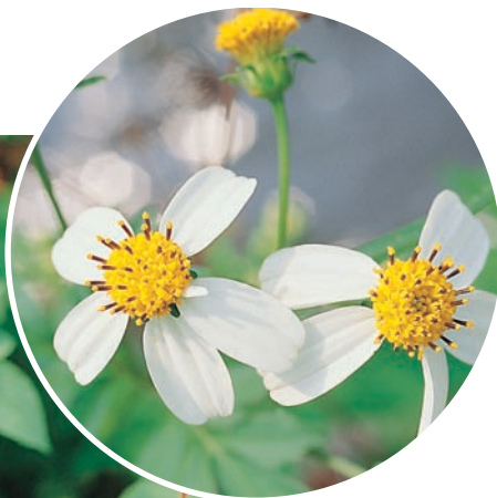
圖十：大花咸豐草成株及花。 （袁秋英、蔣慕琰）