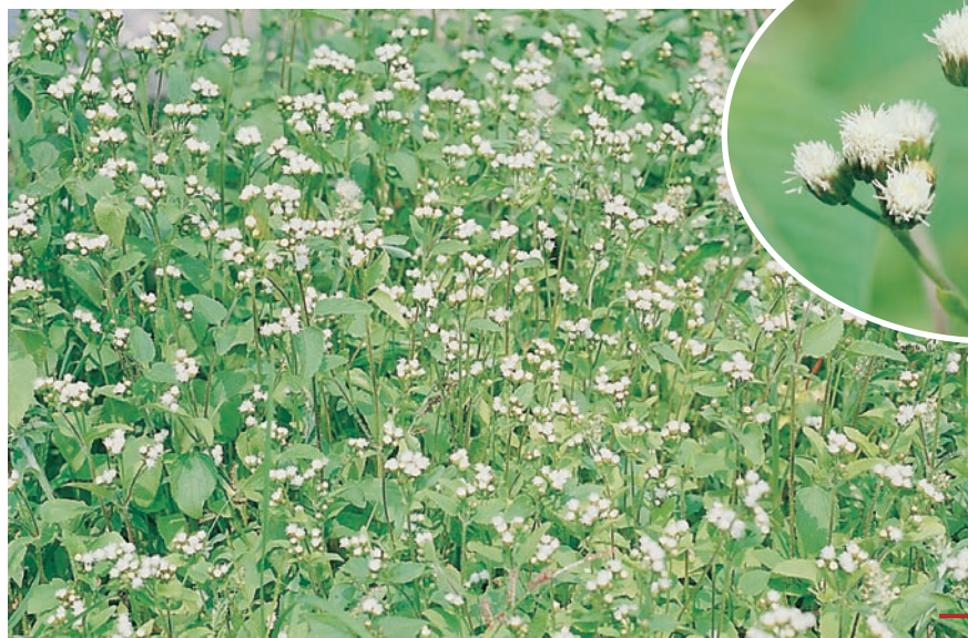
圖八：藿香薷成株及花。（袁秋英、蔣慕琰）