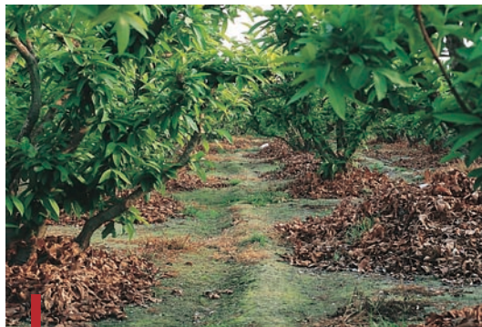
圖二十五：蓮霧樹冠下方覆蓋枝葉。

果園中傳統之割草多使用鐮刀或帶長柄之草刀，此種方法之割草相當辛苦耗工，目前在較專業化之蓮霧園區，則使用背負式回轉剪草機割草；大型之乘坐式剪草機，因價格高維護不易在臺灣少見。一般剪草之高多在5~10公分間，其可使地面保持相當之覆蓋，且不會破壞草類的根系，控制土表雜草生長，增加水分的穿透，土壤有機物之補充量亦較高。由水土保持觀點而言，是園區裡最適宜之雜草防治方法，也是實施草生栽培常使用之管理方式。但割草所能達到有效除草期間最短，尤其在高溫及潮濕季節，割草