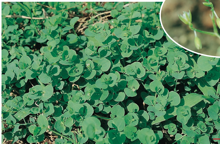
圖七：荷蓮豆草成株及花。 （袁秋英、蔣慕琰）

特性：花梗及花萼具黏性之腺體，易黏著人畜，藉以傳播種子。莖節易生根，葉片覆蓋土表，常形成大群落，適合選留為水土保持用之地被植物。