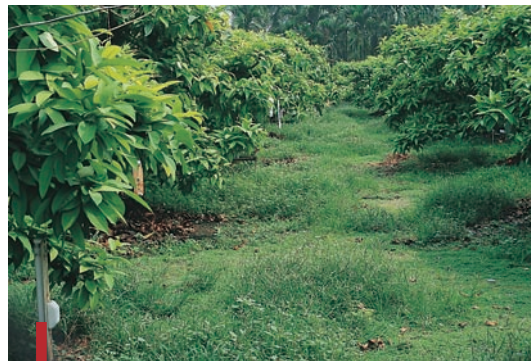
圖四：宜蘭地區之蓮霧園。（袁秋英、蔣慕琰）