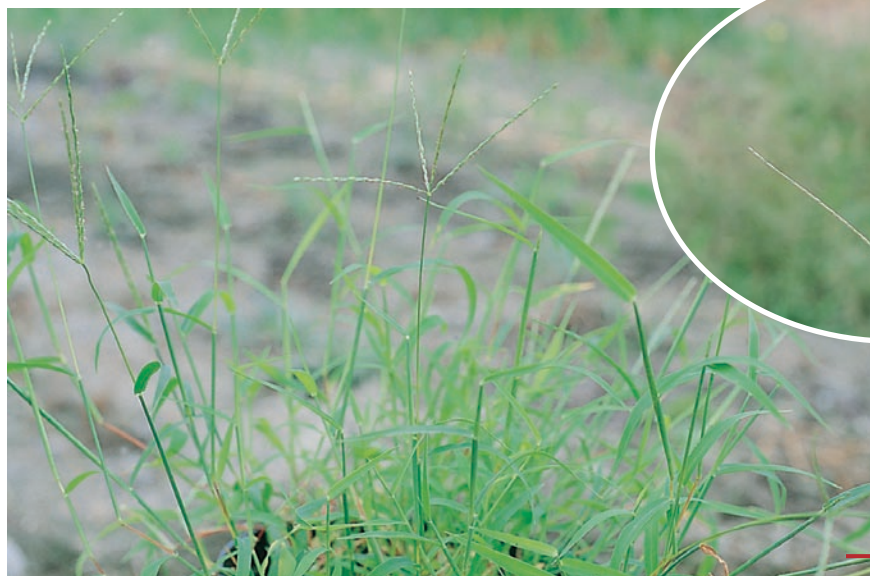
圖十七：馬唐成株及花。 （袁秋英、蔣慕琰）

特性：果園中馬唐草以馬唐及短穎馬唐（ D. setigera Roem. & Schult.）為主，此兩種馬唐草是高溫暖季中主要之果園禾草，干擾園區管理，危害潛力中等。