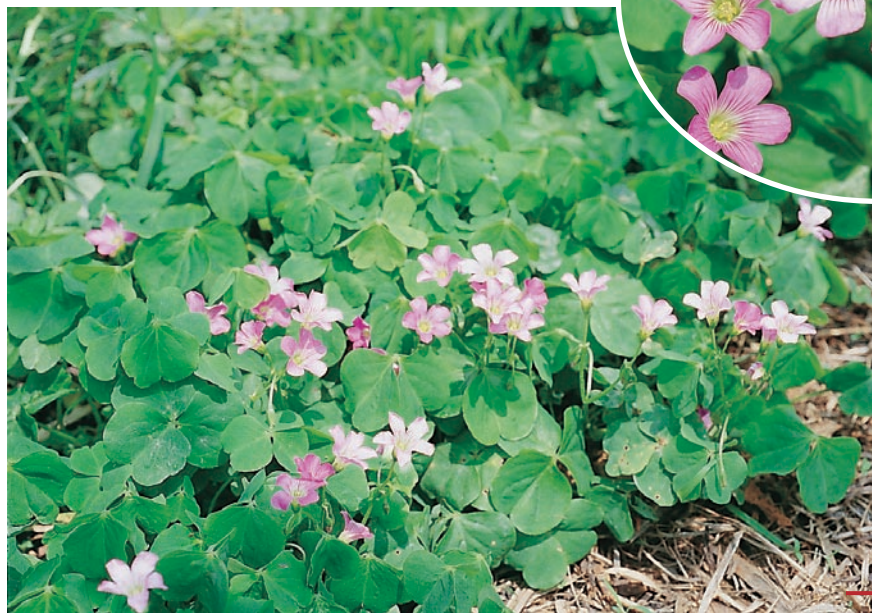
圖二十一：紫花酢漿草成株及花。 （袁秋英、蔣慕琰）