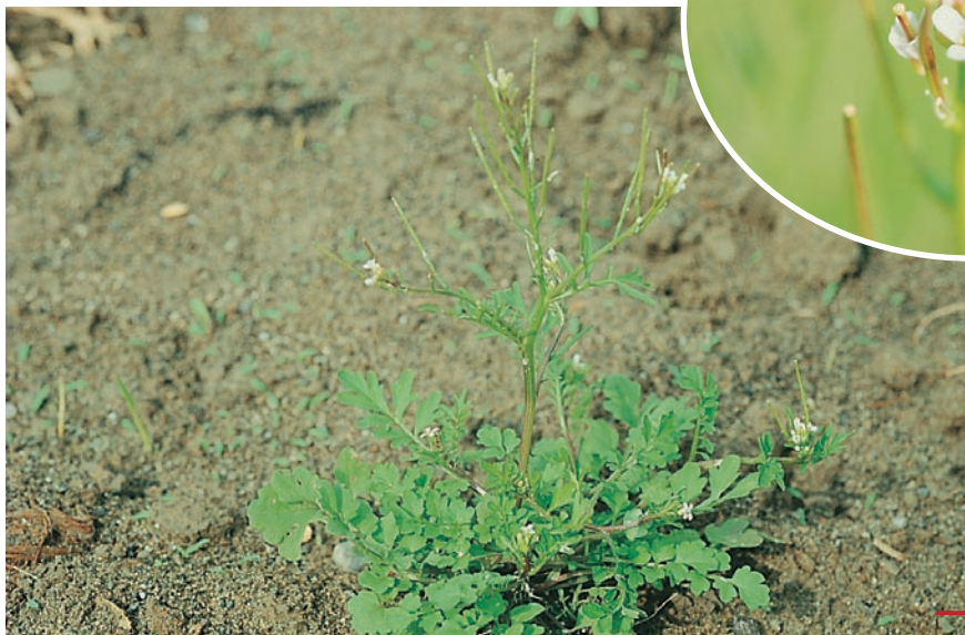
圖十三：焊菜成株及花。 （袁秋英、 蔣慕琰）

特性：屬冷季草，喜冷涼潮濕，株型低矮，常叢生於園區內外，可選留為草生栽培之自生地被植物，危害潛力小。