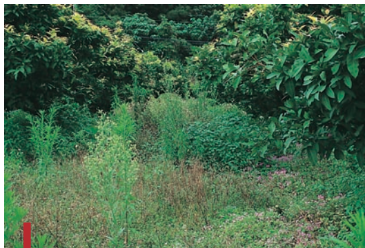
圖二：疏於管理之蓮霧園；雜草叢生。（袁秋英、蔣慕琰）

因此適當的果園雜草管理，絕非完全將雜草去除，而是當雜草造成果樹生育和園區管理干擾時，才移去或抑制其生長。正確的雜草管理理念必須考量的因素包括雜草對作物影響的評估、園區內其他管理作業之配合以及土壤、雨量與氣溫等環境因子的影響，然後選定適當處理方式、時期及次數，以達成最終經濟效益和環境安全性目的。