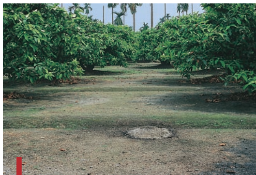
圖一：清耕之蓮霧園。（袁秋英、蔣慕琰）