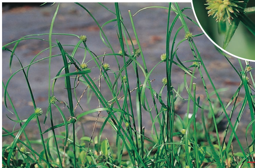
圖十五：短葉水蜈蚣成株及花。 （袁秋英、蔣慕琰）

特性：屬暖季草，喜潮濕。群落叢生於園區，株型低矮，適合選留為草生栽培之自生地被植物。