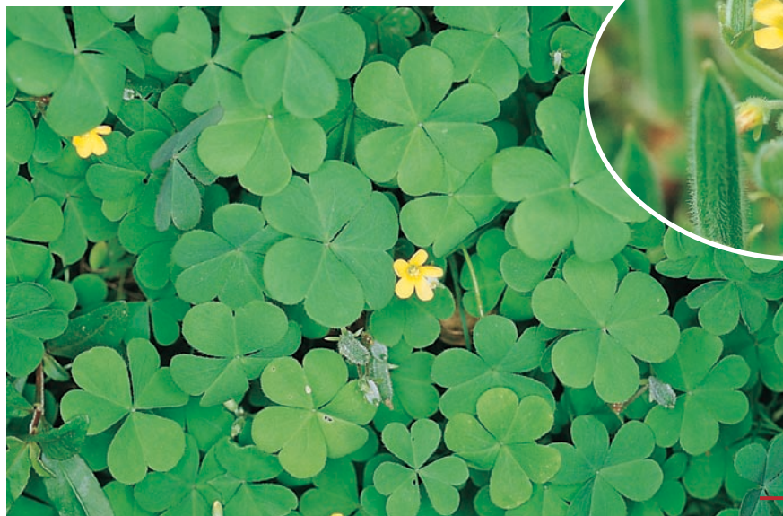
圖二十：酢漿草成株及花。 （袁秋英、蔣慕琰）

特性：心皮具彈性，種子成熟時，心皮捲曲，撒出種子。莖上節位易生根，植株低矮，適合選留為水土保持用之地被植物，危害潛力小。