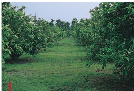
圖二十六：以禾草為主的草生栽培園區。

目前適用於蓮霧園的自生性地被植物包括：荷蓮豆草、焊菜、短葉水蜈蚣、飛揚草、酢醬草、紫花酢醬草、通泉草、小芽草、假吐金菊、假扁蓄等，為形成自生性複合地被植物相的草生栽培園區可選留低矮匍匐的植物，針對高大蔓性植物噴施除草劑，