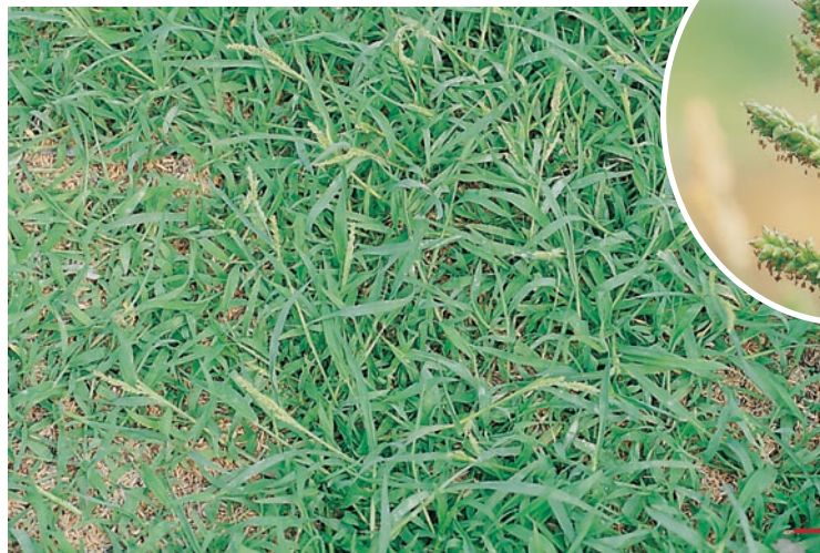
圖十八：芒稷成株及花。

特性：莖稈基部紅紫色，亦稱紅腳稗。易與稗草混淆，其另一特徵為小穗大部分無毛，喜較潮濕之環境，平地果園較多，危害潛力中等。