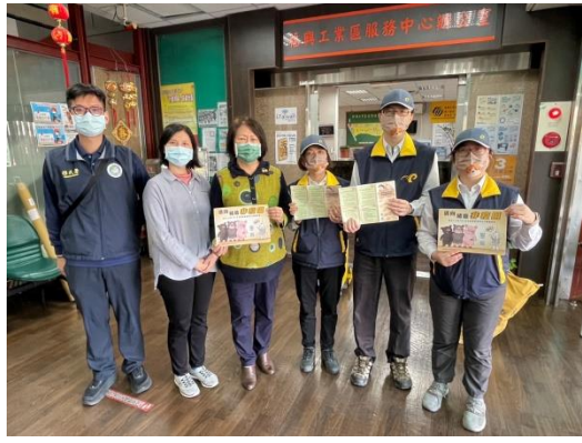
圖 1. 至福興鄉福興工業區以推廣海報及文宣，協請商圈公家機關(經濟部工業局、郵局)廣傳周邊新住民及移工勿攜帶及寄送肉類產品入境台灣。