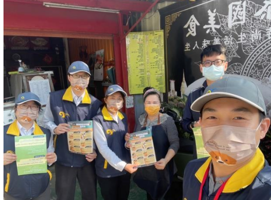
圖 2. 至福興鄉福興工業區以推廣海報及文宣，協請商圈業者廣傳周邊新住民及移工勿攜帶及寄送肉類產品入境台灣。