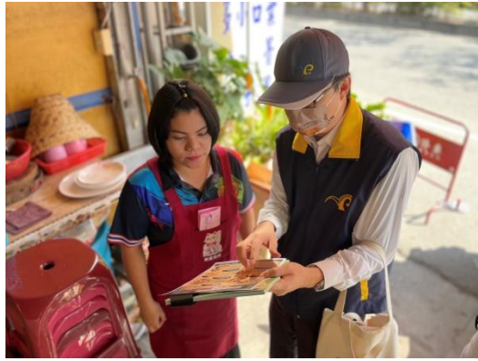
圖 3. 說明違規攜帶動植物產品相關規定。