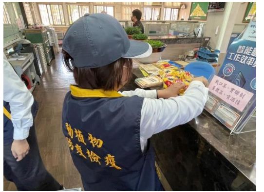
圖 4. 發送推廣小品。