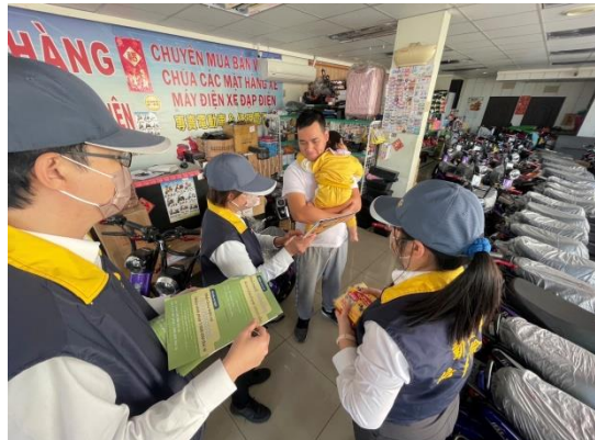
圖 6.