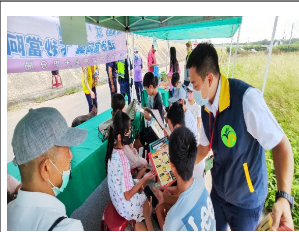
圖 2.向民眾說明違規携帶動植物檢疫產品暨防堵非洲豬瘟相關規定。