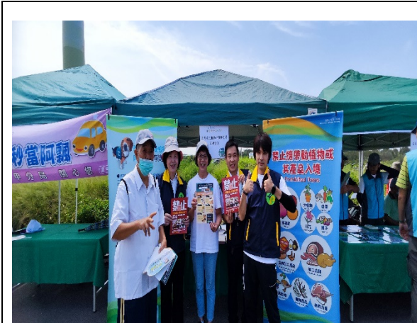
圖 1.向民眾推廣出入國門勿携帶動植物檢疫產品等政策及檢疫措施。