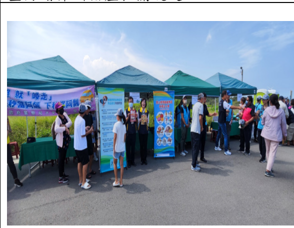
圖 4.向民眾推廣出入國門勿携帶動植物檢疫產品等政策及檢疫措施。