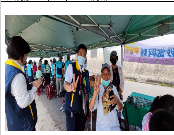
圖 3.向民眾說明違規携帶動植物檢疫產品暨防堵非洲豬瘟相關規定。