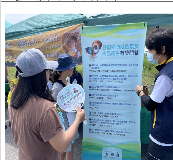
圖 5.現場與民眾互動宣達落實防檢疫措施之重要性。