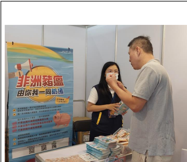
圖 1. 與寵物展區設置攤位，提供參展民眾諮詢動植物檢疫相關法規，另提供宣導摺頁供民眾索取。