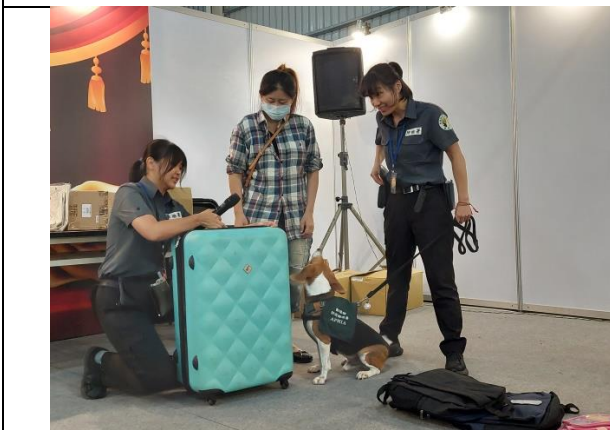
圖 3. 互動時間邀請現場民眾上台參與檢疫犬行李偵測示範，增強民眾參與感。