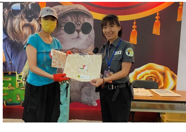
圖 4. 互動時間現場民眾踴躍參與，致贈參與民眾大獎檢疫犬背袋文創品。