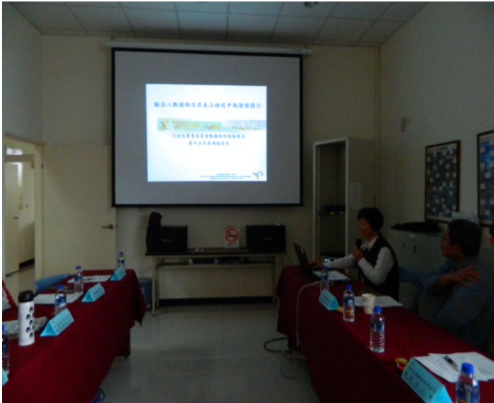
圖 3：檢疫站同仁進行簡報