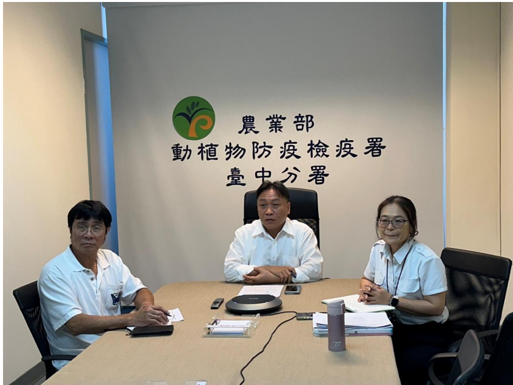
王分署長主持會議