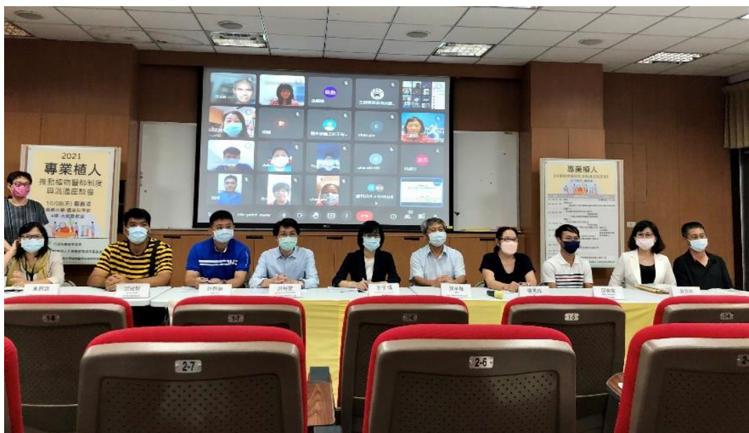
圖 8、主婦聯盟環境保護基金會於國立嘉義大學舉辦【專業植人】推動植物醫師制度與溝通座談會，蒐集利害關係人意見