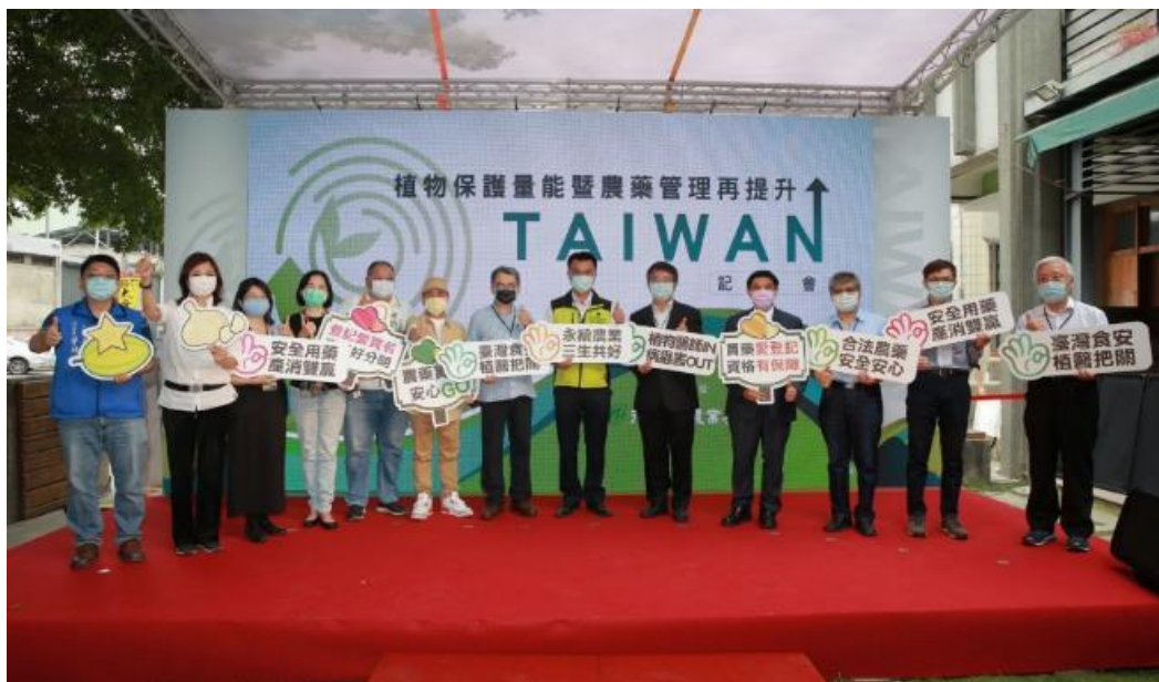
圖 6、於雲林縣荊桐鄉農會舉辦「植物保護量能暨農藥管理再提升」記者會。