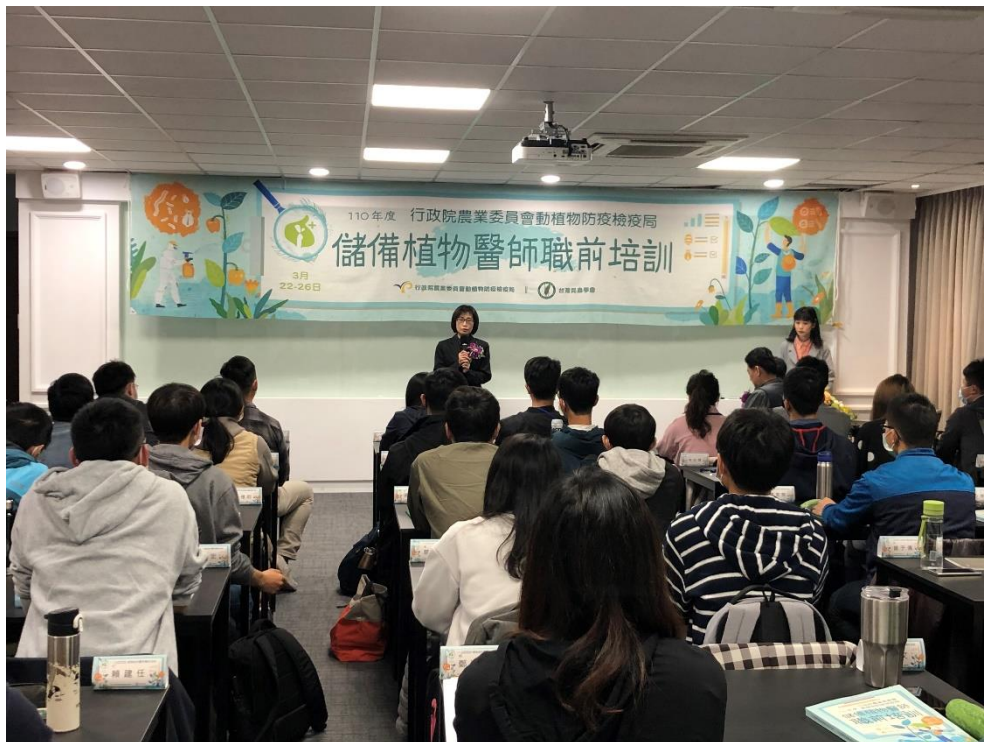
圖 4、110 年於臺中市霧峰區議蘆會館舉辦「儲備植物醫師職前培訓」課程，強化專業人力培訓。