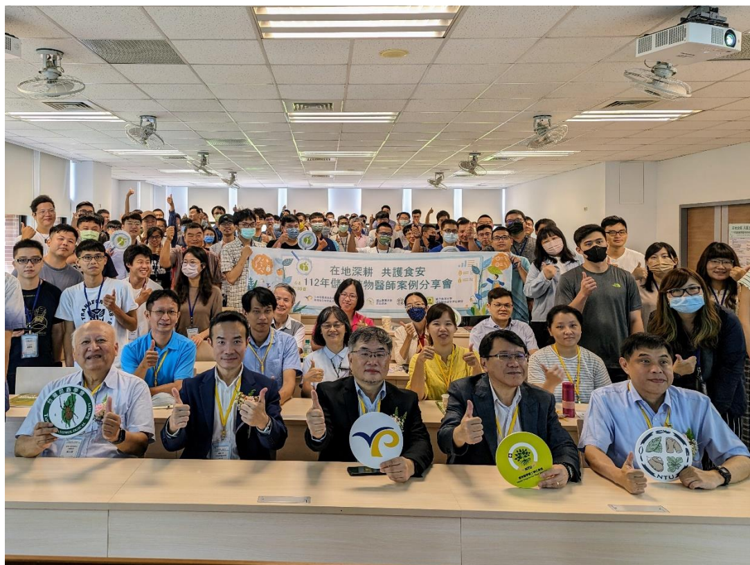
圖 10、於國立臺灣大學辦理儲備植物醫師案例分享會。