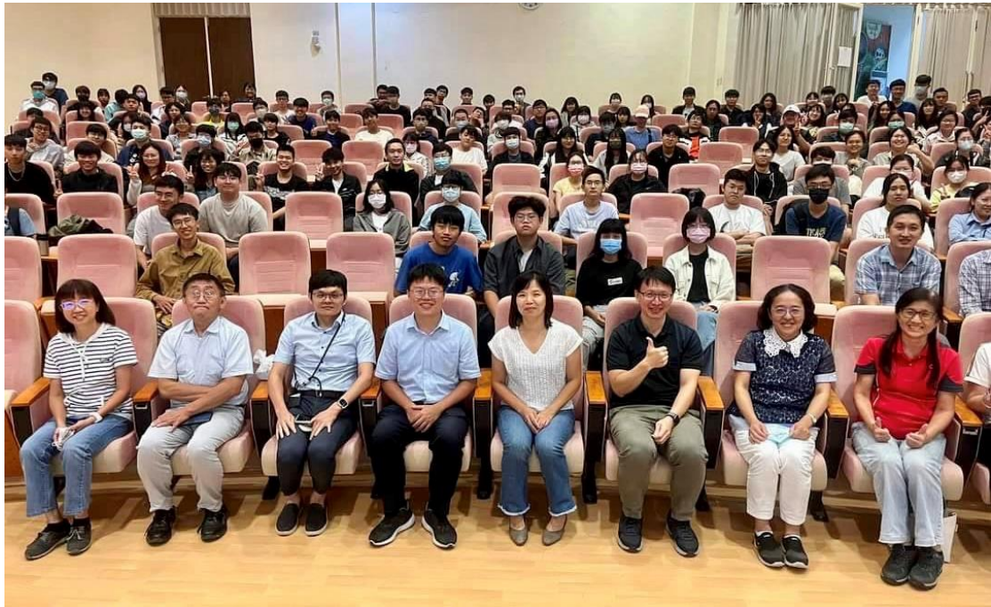
圖 11、辦理植物醫師制度推動現況說明會(國立屏東科技大學場)。