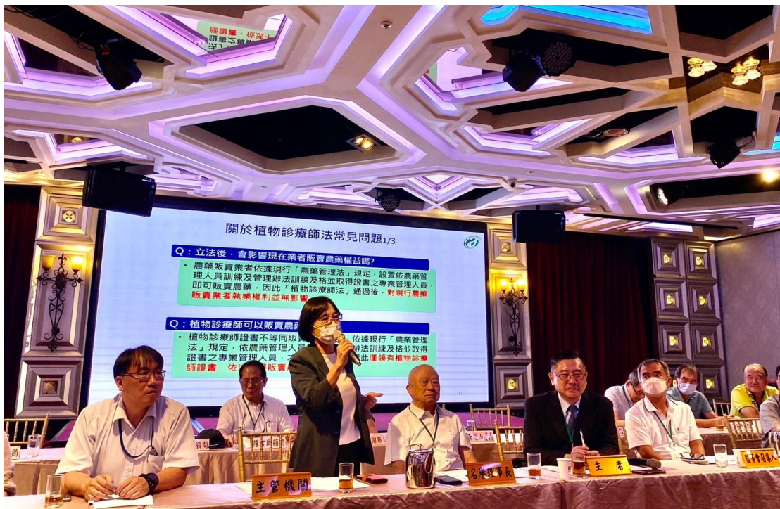
圖 12、辦理「植物診療師法」宣導說明會(植物保護商業同業公會全聯會)。