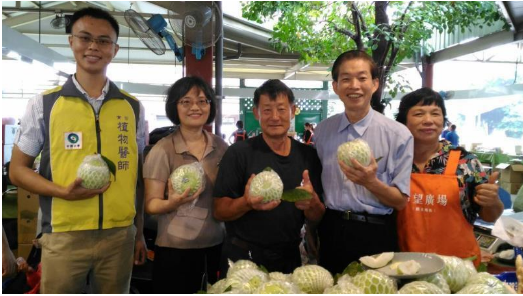
圖 3、媒體報導：植物醫師產地輔導農民在希望廣場展售優質農產品。