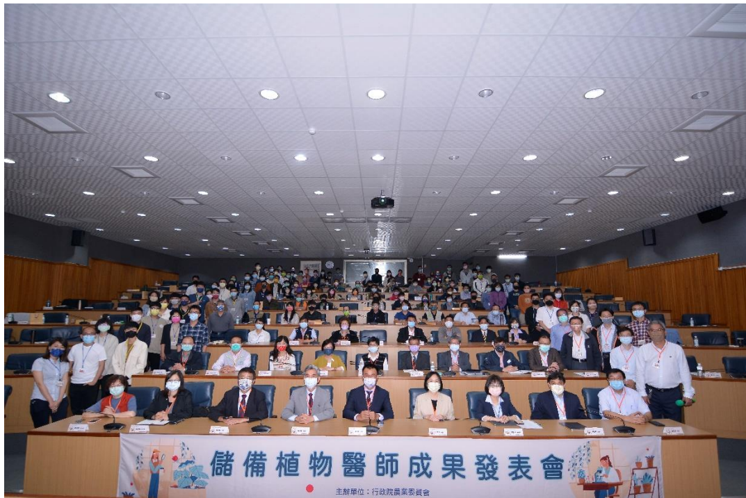
圖 9、於國立中興大學舉辦儲備植物醫師成果發表會。