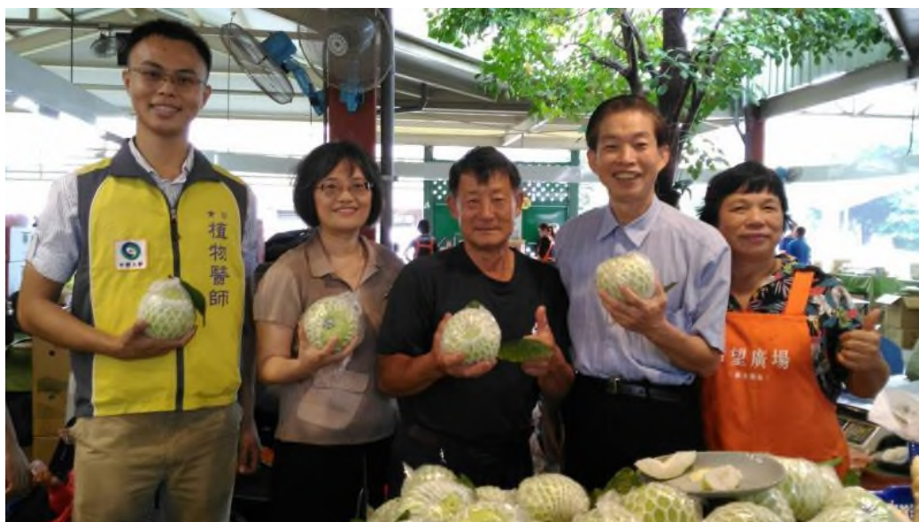
圖 3、媒體報導：植物醫師產地輔導農民在希望廣場展售優質農產品。