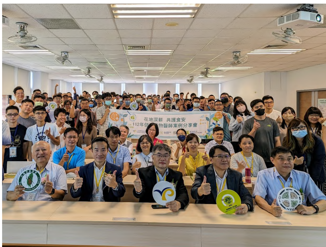
圖 10、於國立臺灣大學辦理儲備植物醫師案例分享會。