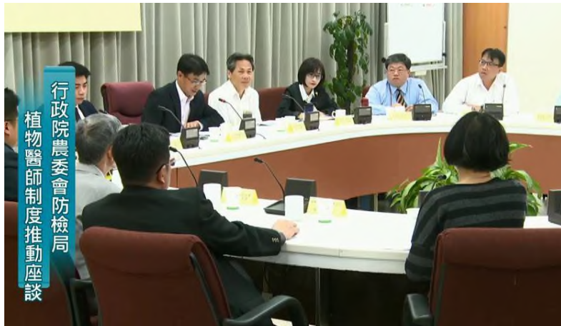
圖 1、防檢署邀請農企業、公民團體及四所大學植物保護相關科系專家學者，共同參與植物醫師制度推動座談會。