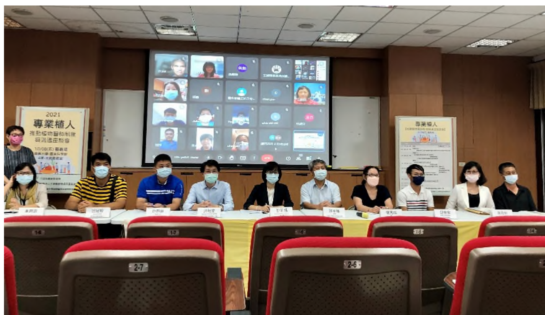
圖 8、主婦聯盟環境保護基金會於國立嘉義大學舉辦【專業植人】推動植物醫師制度與溝通座談會，蒐集利害關係人意見