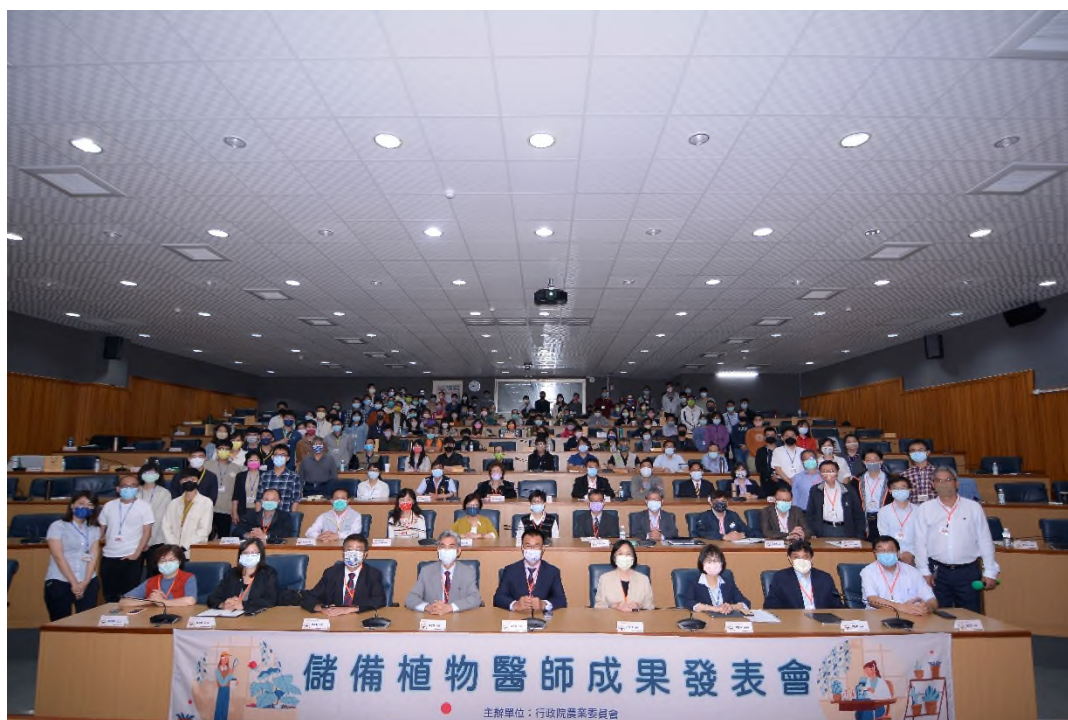
圖 9、於國立中興大學舉辦儲備植物醫師成果發表會。