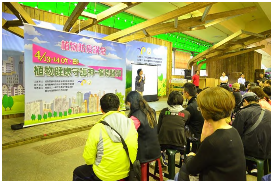
圖 2、於臺北市假日建國花市舉辦「植物防疫講堂」，增加民眾對植物醫師的認識。