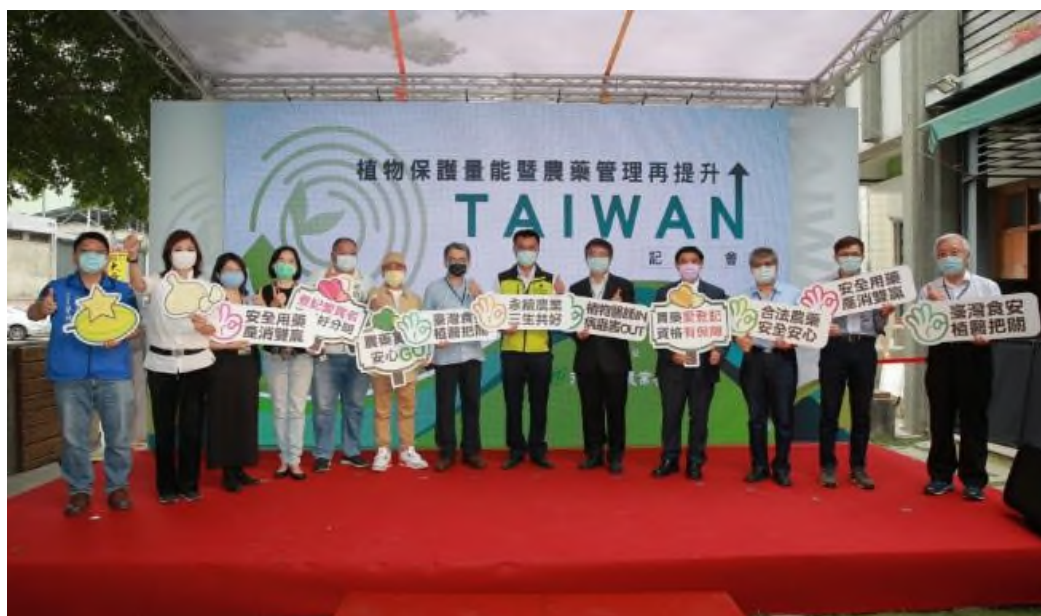
圖 6、於雲林縣莿桐鄉農會舉辦「植物保護量能暨農藥管理再提升」記者會。