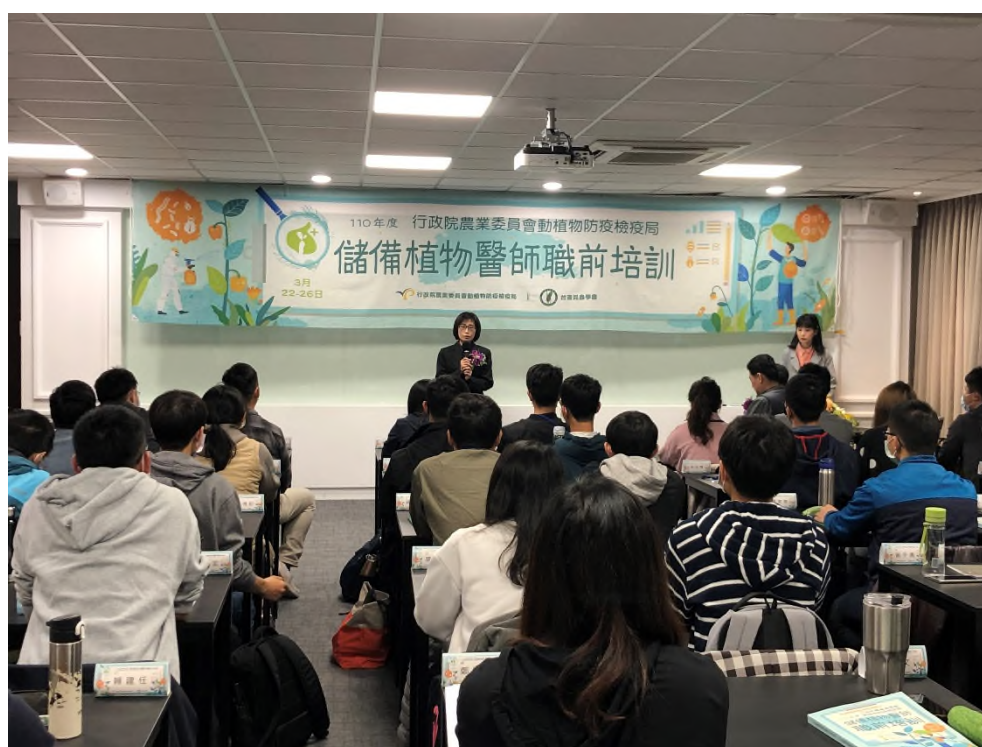
圖 4、110 年於臺中市霧峰區議蘆會館舉辦「儲備植物醫師職前培訓」課程，強化專業人力培訓。