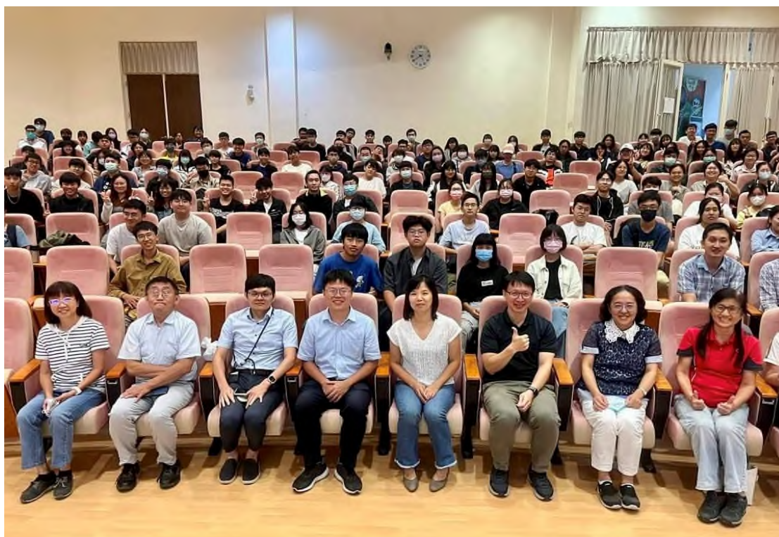
圖 11、辦理植物醫師制度推動現況說明會(國立屏東科技大學場)。