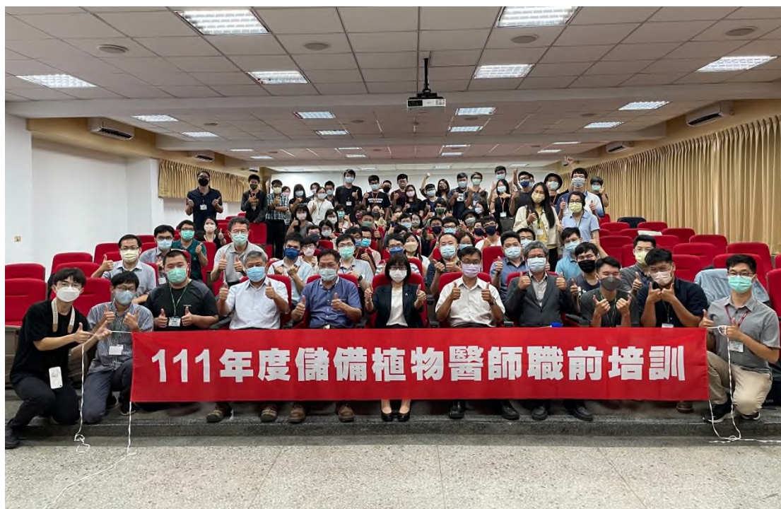
圖 5、111 年於國立嘉義大學舉辦「儲備植物醫師職前培訓」課程結訓典禮合影。