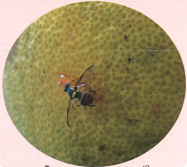
東方果實蠅在文旦果實產卵