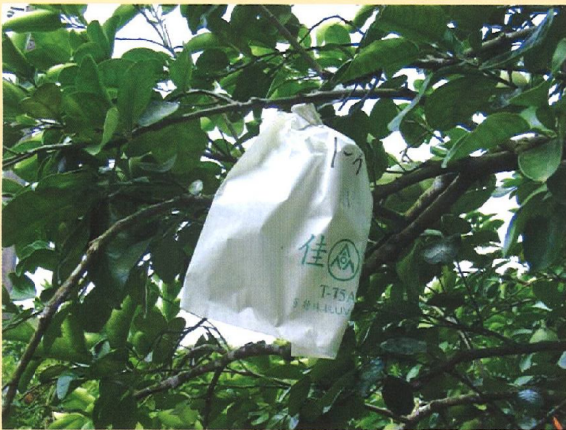
生理落果期後進行套袋可防止日燒與東方果實蠅危害