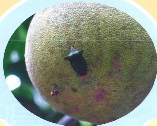
椿象取食為害文旦狀

5、對症用藥與適時防治為病蟲害管理最重要的工作，於各時期配合該月份常見病蟲害以植物保護手冊推薦藥劑進行防治工作。