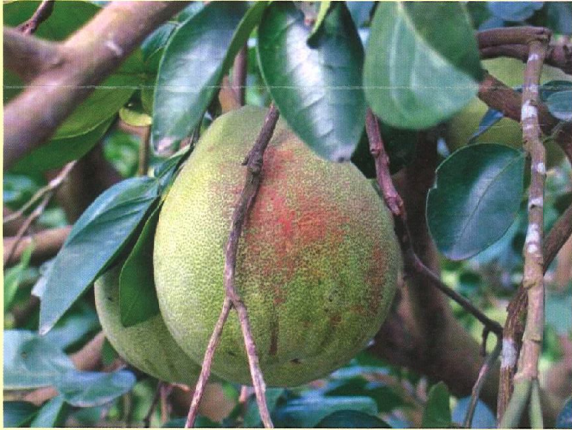
枝條摩擦造成果實表皮受損，影響商品價值

2、確實進行整枝修剪工作，增加果園內的通風，以免因環境過於潮濕導致病蟲害容易滋生，同時可避免結果期時果實表皮因枝條摩擦而受損。