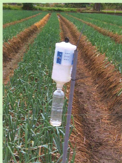
懸掛甜菜夜蛾 性費洛蒙誘蟲 盒誘殺甜菜夜 蛾雄蛾

5、對症用藥與適時防治為病蟲害管理最重要的工作，於各時期配合該月份常見病蟲害以植物保護手冊推薦藥劑進行防治工作。