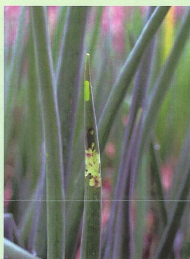
甜菜夜蛾幼蟲鑽入青蔥蔥管內 啃食