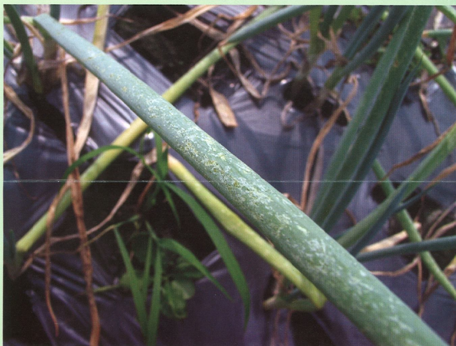
薊馬危害青蔥 蔥管表面