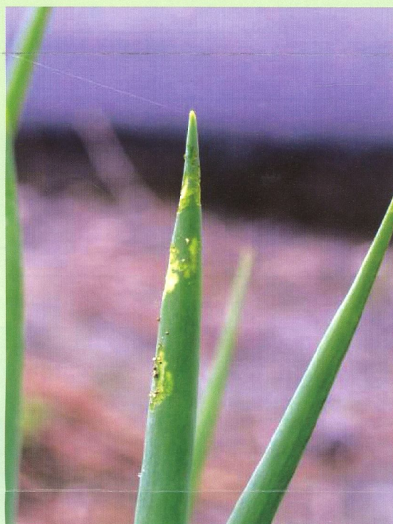
夜蛾類幼蟲啃食青蔥蔥管表面