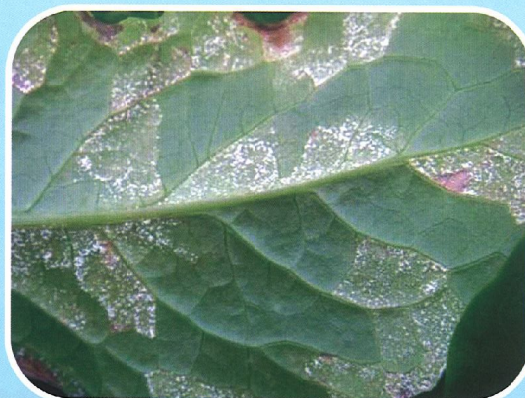
圖二 萵苣露菌病病徵圖片