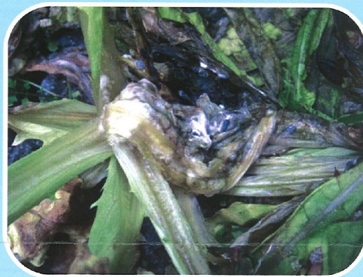
圖一 萵苣菌核病病徵圖片