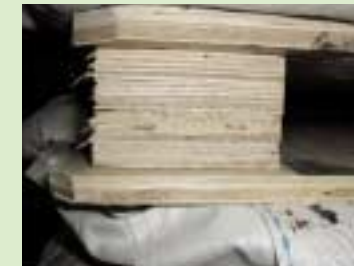
②采用胶合板(plywood)的托板