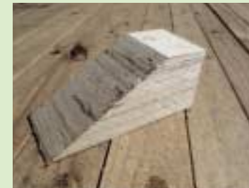
①采用LVL(laminated veneer lumber)的楔子(档木)