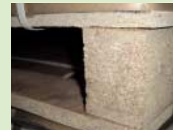
④采用硬质纤维板(particleboard)的托板