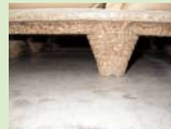
③采用硬质纤维板(particleboard)的垫木