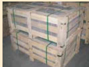
⑤木框,木条箱,格子箱(wooden crate)