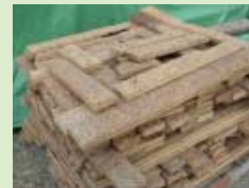
⑤采用硬质纤维板(particleboard)的垫板