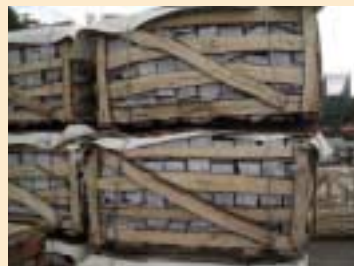
④木框,木条箱,格子箱(wooden crate)