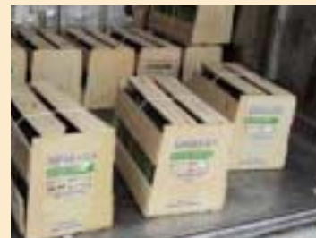
⑥木框,木条箱,格子箱(wooden crate)