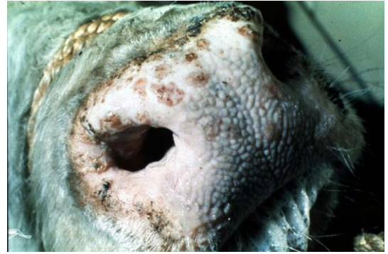
鼻鏡上可見多處輕微凸起的丘疹，表層通常伴隨糜爛並延伸入鼻孔