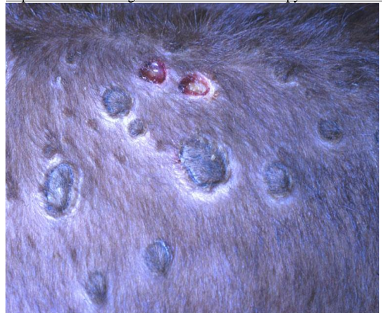
痂皮脫落後呈現坐鞍瘤(seatfasts)

https://www.nadis.org.uk/disease-a-z/cattle/lumpy-skin-disease/