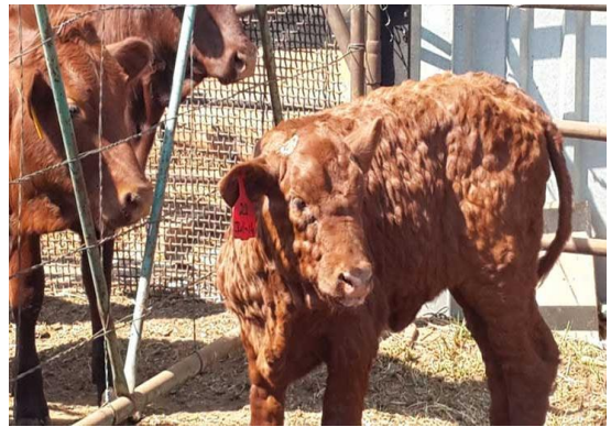
牛隻感染牛結節疹皮膚明顯的結節或硬塊

https://www.pirbright.ac.uk/news/2017/07/news-feature-emergence-lumpy-skin-disease-europe