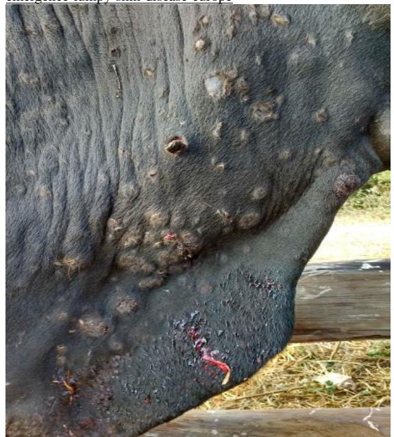
牛隻感染牛結節疹皮膚典型的結節 (John Atkinson 拍攝)

https://www.pirbright.ac.uk/news/2017/07/news-feature-emergence-lumpy-skin-disease-europe