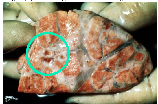
肺臟瀰漫性明顯之小葉間隔水腫，檢體左側有一小簇紅色結節。

http://www.cfsph.iastate.edu/DiseaseInfo/disease-images.php?name=lumpy-skin-disease&lang=en