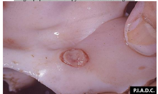
牛鼻甲黏膜結節之糜爛病變