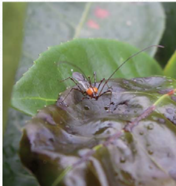
茶角盲椿象 (圖片皆來自茶改場的網站)。

被害處形成黑褐色斑點，蟲體愈大，危害斑點愈大，其移動性及被害枝條數亦愈多。嚴重時被害芽停止生長且萎縮，甚至造成落葉，不但茶樹生長受阻且影響茶菁外觀、產量降低，其成茶水色呈黑褐色，滋味帶苦，影響製茶品質。