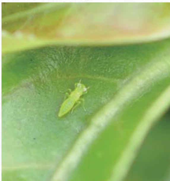
小綠葉蟬 (圖片皆來自茶改場的網站)。

小綠葉蟬主要於成、若蟲時期以其刺吸式口器吸食茶樹芽葉或幼嫩組織的汁液，芽葉或幼嫩組織受害後使其生長發育受阻。危害初期幼葉及嫩芽呈黃綠色，嚴重時茶芽捲縮不伸長，葉呈船形捲曲，葉緣褐變，終至脫落。