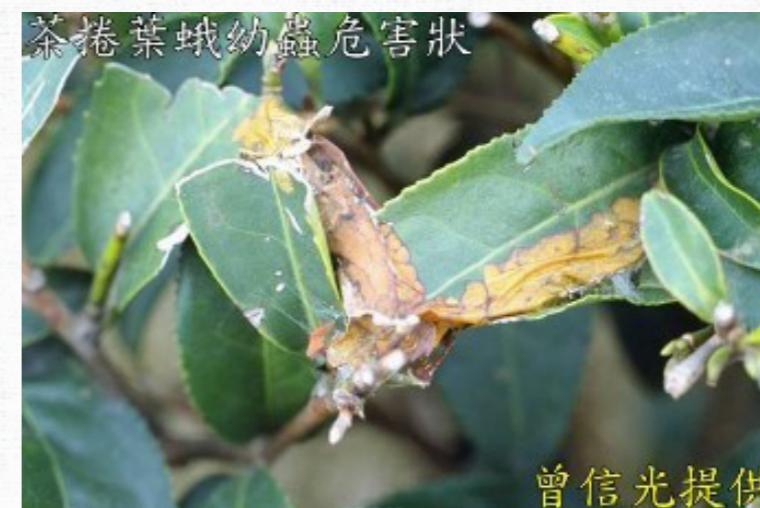
茶捲葉蛾幼蟲危害狀。

為臺灣茶園中極普遍之害蟲，一年發生六世代，發生甚不整齊，各蟲期常混雜發生，難以分辨出其所屬之世代。卵呈魚鱗塊狀產於葉面，黃色。幼齡蟲淡灰綠色，成熟時呈黃綠色，在捲葉內化蛹。