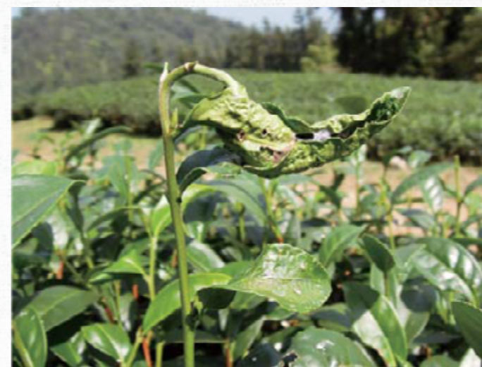
黑姬捲葉蛾幼蟲危害狀。