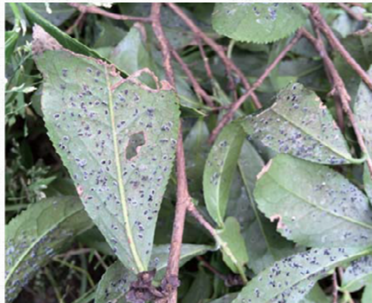
柑橘刺粉蝨及危害狀。

柑橘刺粉蝨發生多時，葉片背面佈滿各生長期之該蟲，狀似芝麻，而若蟲分泌之蜜露則誘發煤煙病，致使寄主植物枝葉變黑，樹勢衰退。