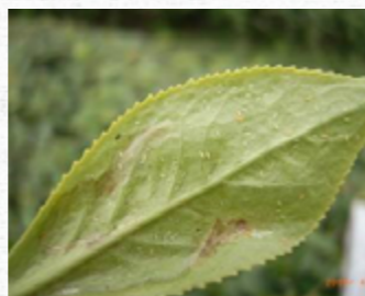
小黃薊馬及危害狀。