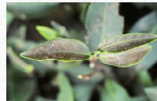
蟎蜱類危害狀 (圖片皆來自茶改場的網站)。

主要造成葉片褐化、容易落葉情形。可依初發生位置辨別不同種蟎蜱危害，如茶神澤氏葉蟎主要發生在成葉葉背；茶葉蟎棲息於成葉葉面為害；錫蘭偽葉蟎於成葉及老葉葉背，造成嚴重危害時多於葉基部近葉柄處逐漸向葉主脈附近為害；桔黃銹蟎主要為害芽及嫩葉；紫銹蟎多棲息於老葉葉面為害；茶細蟎棲息在嫩葉葉背為害。