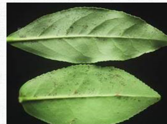
褐色圓星病葉部病徵。

茶褐色圓星病主要發生在葉片上，有二型病斑，一型為褐色圓斑，初期在葉片上形成褐色小點，漸漸擴大為圓型或不規則型之斑點，此型病斑會產生大量的分生孢子。另一為綠斑型，在葉背初期為針狀，可擴大到 2 至 3mm 大小，罹病組織的細胞較正常細胞為腫大，顏色呈淡綠色，將罹病葉片對光看時，病斑上的顏色較淡，此型病斑呈彌漫性墨綠色小斑點，均勻的分布於葉背，病斑隨著葉片的老化漸漸聚集在一起，呈墨綠色凸起。臺灣常發現的病斑屬於綠斑型病斑，大部份茶樹品種皆會感染本病。