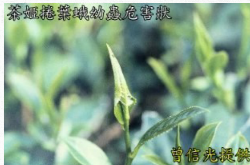
茶姬捲葉蛾幼蟲危害狀。

年發生八世代，各世代重疊，於3、4月春茶萌芽時逐漸增加，9至10月秋茶採收後密度驟降。卵塊呈魚鱗狀產於葉背，初孵化幼蟲常棲於芽內或未展開嫩葉邊緣內取食，二齡後吐絲由葉尖向中心捲起，棲於捲葉內為害。若無茶芽時，幼蟲可潛棲於老葉相接空隙內為害。