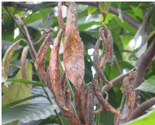
蚜蟲危害徵狀，新梢嚴重枯萎。