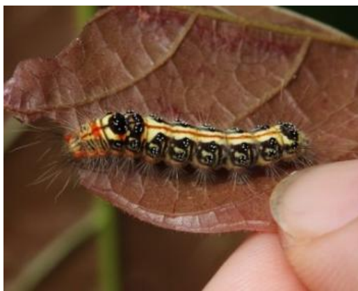
毒蛾類幼蟲。