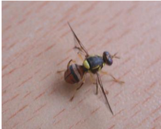
東方果實蠅成蟲。