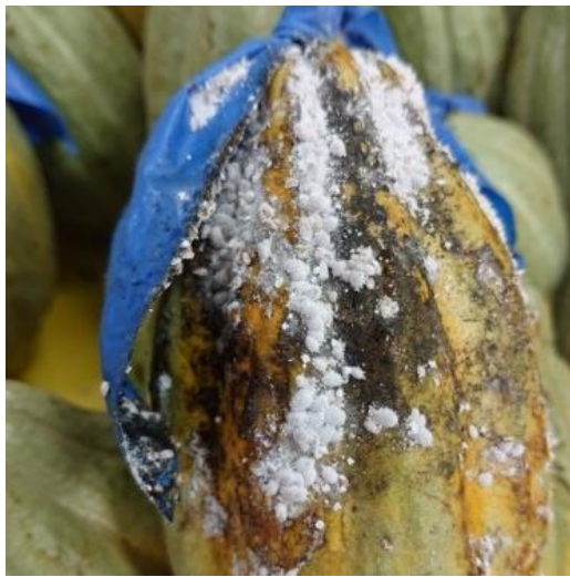
粉介殼蟲危害徵狀，果實佈滿粉介殼蟲（圖／陳明吟）。

若蟲孵化後鑽出囊外，棲息於植株陰涼處，包括葉片、枝條、花、果實及果柄等處，刺吸植株汁液。嚴重時會造成葉片乾燥脫落、幼芽嫩枝停止生長及樹勢衰弱，尤其是木瓜秀粉介殼蟲，在取食同時還會注入有毒物質，導致葉片色澤轉淡或畸形、植株變得矮小。粉介殼蟲亦會分泌蜜露誘引螞蟻前來取食，並誘發煤煙病。 • 發生生態：目前出現在可可樹上的粉介殼蟲種類繁多，包括太平洋臀紋粉介殼蟲（Passionvine mealybug； Planococcus minor (Maskell)）、橘臀紋粉介殼蟲（Citrus mealybug； Planococcus citri (Risso)）及木瓜秀粉介殼蟲（Papaya mealybug； Paracoccus marginatus Williams & Granara de Willink）等。上述介殼蟲全年皆可發生，以春秋兩季雨水少時發生較嚴重。常在通風不良、溼度高的環境下快速繁殖，與螞蟻共生會加速蔓延。粉介殼蟲可藉螞蟻保護及搬運，減少天敵危害，同時增加族群散布範圍。