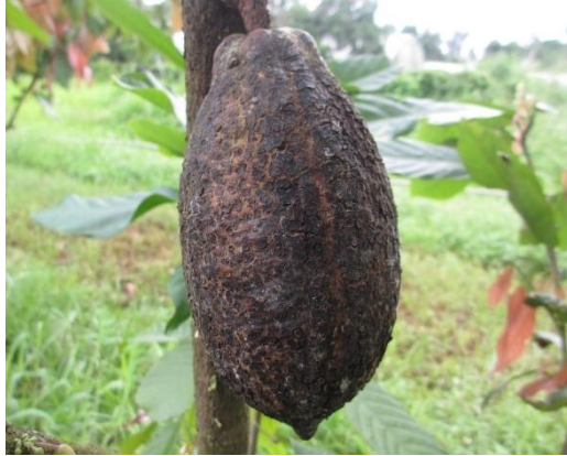
黑腐病病徵。